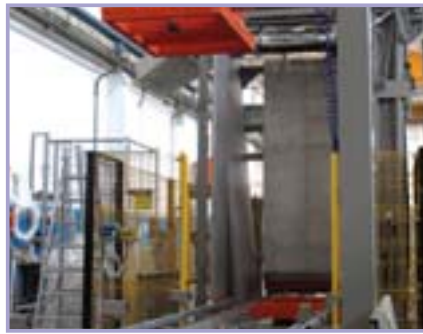
Détail du top presser.