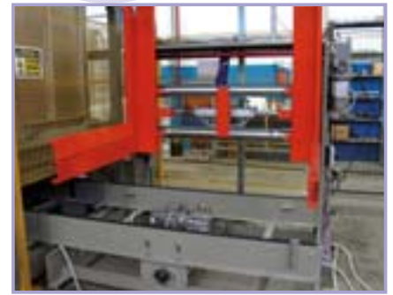
Détail du magasin palette.

DEP MASTER peut atteindre des cadences très élevées avec n'importe quel type de palette et bouteille: